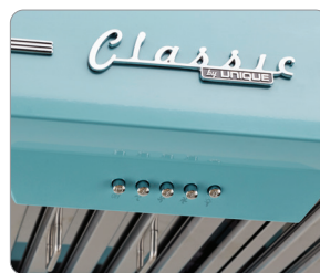
Easy to use controls