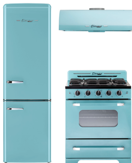
The perfect match for the Classic Retro by Unique 30" range and fridges