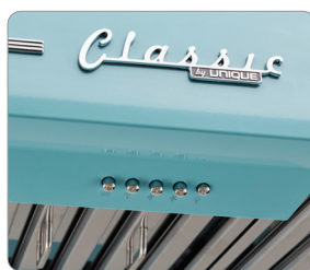
Boutons faciles à utiliser