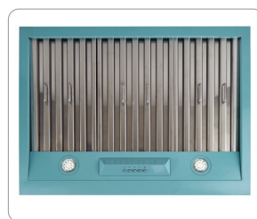
Two LED lights and three dishwasher-safe stainless-steel baffle filters x 3