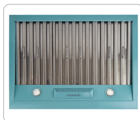
Filtres à labyrinthe en acier inoxydable, lavables au lave-vaisselle