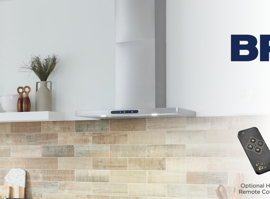
Optional HCR4 Remote Control.